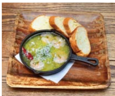
海老とシラスのアヒージョ：魚介の旨味が溶け込んだガーリックオイルをバケットと一緒に。