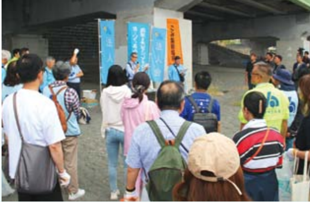
海洋汚染のお話のようす