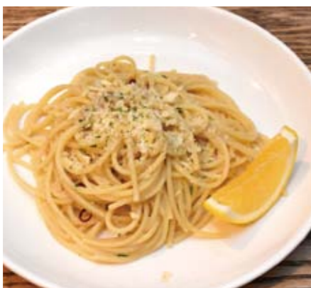
アンチョビとライムのペペロンチーノ

次におすすりめしたいのが肉料理。スペアリブはナイフを添えるだけで骨からすっと身が外れる柔らかさ。ソースはガーリックバターやハーブマス、タードなど種類から選ぶことがで