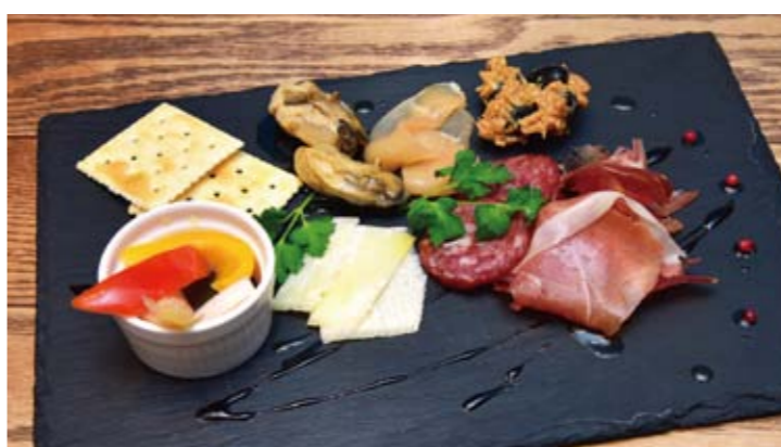
本日の前菜の盛り合わせ

気さくな店長とスタッフの方の温かい接客も印象的で、初めて訪れる方でも安心して過ごせるお店です。ランチや会合、懇親の場まで、幅広い場面で利用したい座間駅前のダイニングバルです。