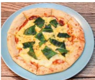
マルゲリータ：素材を活かしたシンプルながら飽きのこないピザ。辛党の方は豊富に取り揃えられた各種タバスコを試してみてください。

きるの訪れるたびに別の味を楽しんでみるのもいいですね。程よく火入れされた自家製ローストビーフは店長自作の深く深いオリジナルソースと相性抜群。北海道から取り寄せている店長こだわりのペーコンステーキもおすすりめです。これらの肉料理がまとめて盛りだくさんの「肉盛りプレート」も好評とのこと。パスタメニューも豊富で、この日は「アンチョビとライムのペペロンチーノ」をいただきました。人気のペペロンチーノにアンチョビの旨味が変わり、足柄の農家から取り寄せている新鮮なライムを絞ることで、さっぱりとした一味違う美味しさが楽しめます。こちらはインスタグラムの投稿を提示した方のみが注文できる限定メニューとのことなので、インスタグラムも要チェックです。