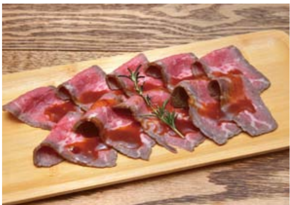
自家製ローストビーフ