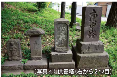
（写真④）供養塔（右から2つ目）