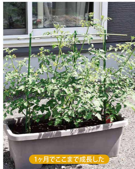
1ヶ月でここまで成長した