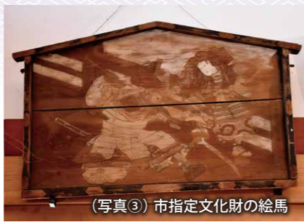
（写真③）市指定文化財の絵馬