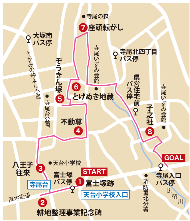
「あやせの高台コース」