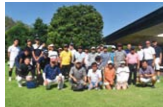
事業研修委員会の主催でチャリティーゴルフコンペを開催しました。