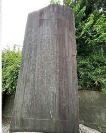
2 耕地整理事業記念碑