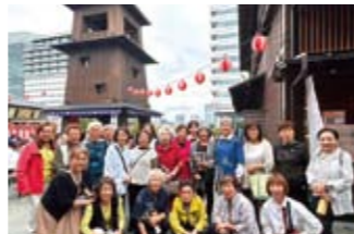
女性部会では会員親睦研修旅行を開催しました。