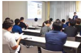
青年部会の主催で定例研修会を開催しました。