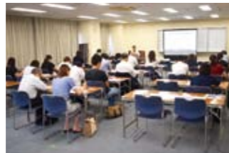
源泉部会の主催で定例研修会を開催しました。