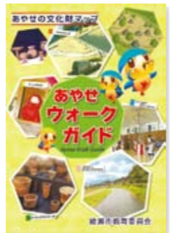
〔参考文献〕 綾瀬市教育委員会 『あやせウォークガイド』

こちらのコースを紹介している「あやせウォークガイド」は綾瀬市役所生涯学習課窓口で無償配布されています。