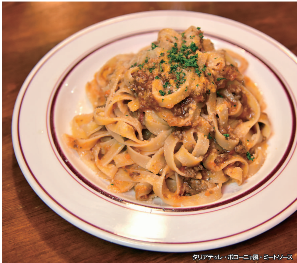
タリアテッレ・ポローニャ風・ミートソース