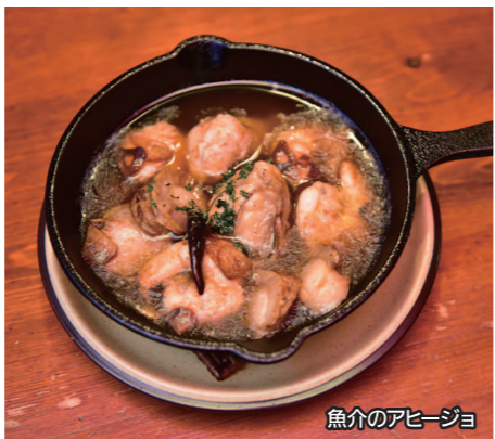
魚介のアヒージョ

「魚介のアヒージョ」はニンニクの効いたオリーブオイルソースにエビ、ホタテ、牡蠣が満載。魚介の旨味がたっぷり染みたソースはパンとの相性抜群なのでバケットも一緒に注文するのがおすすめです。