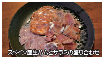
スペイン産生ハムとサラミの盛り合わせ

まずはオーナーシェフおすすめの前菜をオーダー。こちらのお店では契約農家から仕入れた有機野菜を主に使用しており、「シェフの気まぐれサラダ」はその日の旬な野菜をシンプルながらコク深い自家製ドレッシングで頂きます。