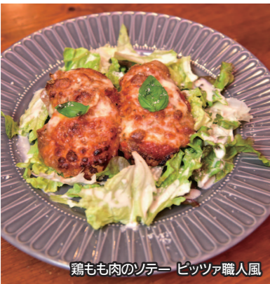
鶏もも肉のソテー ピッツァ職人風

メインのお肉料理はその日のおすすめメニューから「鶏もも肉のソテーピッツァ職人風」をチョイス。トマト、チーズ、バジルが載せられたマルゲリータ風のチキンは皮がパリッと中はジューシーに焼き上げられた逸品です。