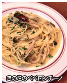
きのこのペペロンチーノ