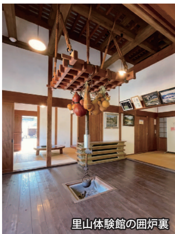
里山体験館の囲炉裏

里山体験館をあとに、西に進むと長屋門があります。長屋門は映えスポットみたいで、谷戸山公園の西の顔になります。