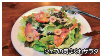
シェフの気まぐれサラダ

さがみ野駅から長後駅行きのバスで10分程、風車公園の斜向かいにイタリアンレストラン「カーサミツレ」があります。入り口のイタリア国旗の看板が目印です。 オーナーシェフは座間市の名店イタリアン「ラ・リッチェッタ」で修業を積んだ後、9年前にこちらのお店を創業したそうです。店内はテーブルとカウンター合わせて15席程。お洒落で落ち着いた隠れ家的な雰囲気です。