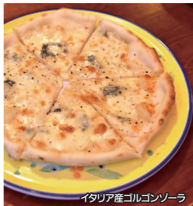
イタリア産ゴルゴンゾーラ