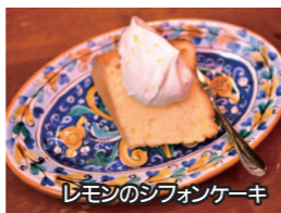
レモンのシフォンケーキ