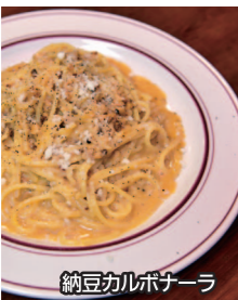
納豆カルボナーラ

シェフの一押しパスタは「タリアテッレ・ポローニャ風・ミートソース」。平たいパスタに牛肉とトマトの旨味がよく絡んで口いっぱい広がります。「きのこのペペロンチーノ」もキノコそのものの味が活かされたとても美味しいパスタです。その他、過去に訪れていた有名名店番組の記念品に書かれた「納豆カルボ最高!」というメッセージを見てこちらも注文。ひきわりの納豆と卵のクリームソースが絶妙にマッチした「納豆カルボナーラ」はメニューには載っていない隠れメニュー(?)のようですが、納豆好きの方はぜひ注文してみてください。