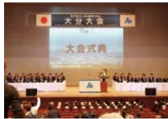
第33回全国青年の集い大分大会の様子

全国の法人会 青年部会が集まり、各会が実施している「租税教育活動」の事例発表を行う青年部会の全国大会です。全国に440会ある法人会から代表として選ばれた11会の青年部会がそれぞれ工夫した租税教育活動の発表を行います。