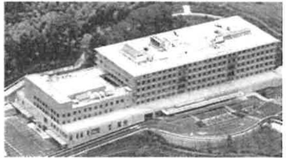
平成24年8月開院の新しく清潔な病院です。