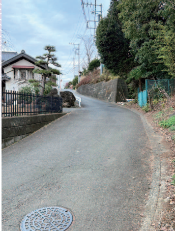
5 古東海道 ことうかいどう

そこから坂を上りながら北へ300mほど歩くと「小園子之社」があります。大国主命を祭神として1605年に創建され、本殿の棟札等が綾瀬市指定文化財に登録されています。歴史を感じる本殿やご神木の他、境内の隅々まで丁寧に手入れがされていました。心が洗われるような清らかな神社です。