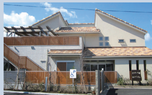
さくらの森保育園

その後、「わにわに食堂(子供食堂)」を運営したり、一人親家庭支援のため「フードパントリー」や地域の方々からの寄付による、「フードドライブ」等の活動もしている。それらはすべて「子供たちの成長は、未来社会を切り拓くかけがえのないもの。子どもたちがその子らしく育つ権利を保障され、おとなたちは喜びを持って子育てを楽しめる、そんなコミュニティづくりをめざす」を理念に運営している。 そして、子供を預けている親御さん