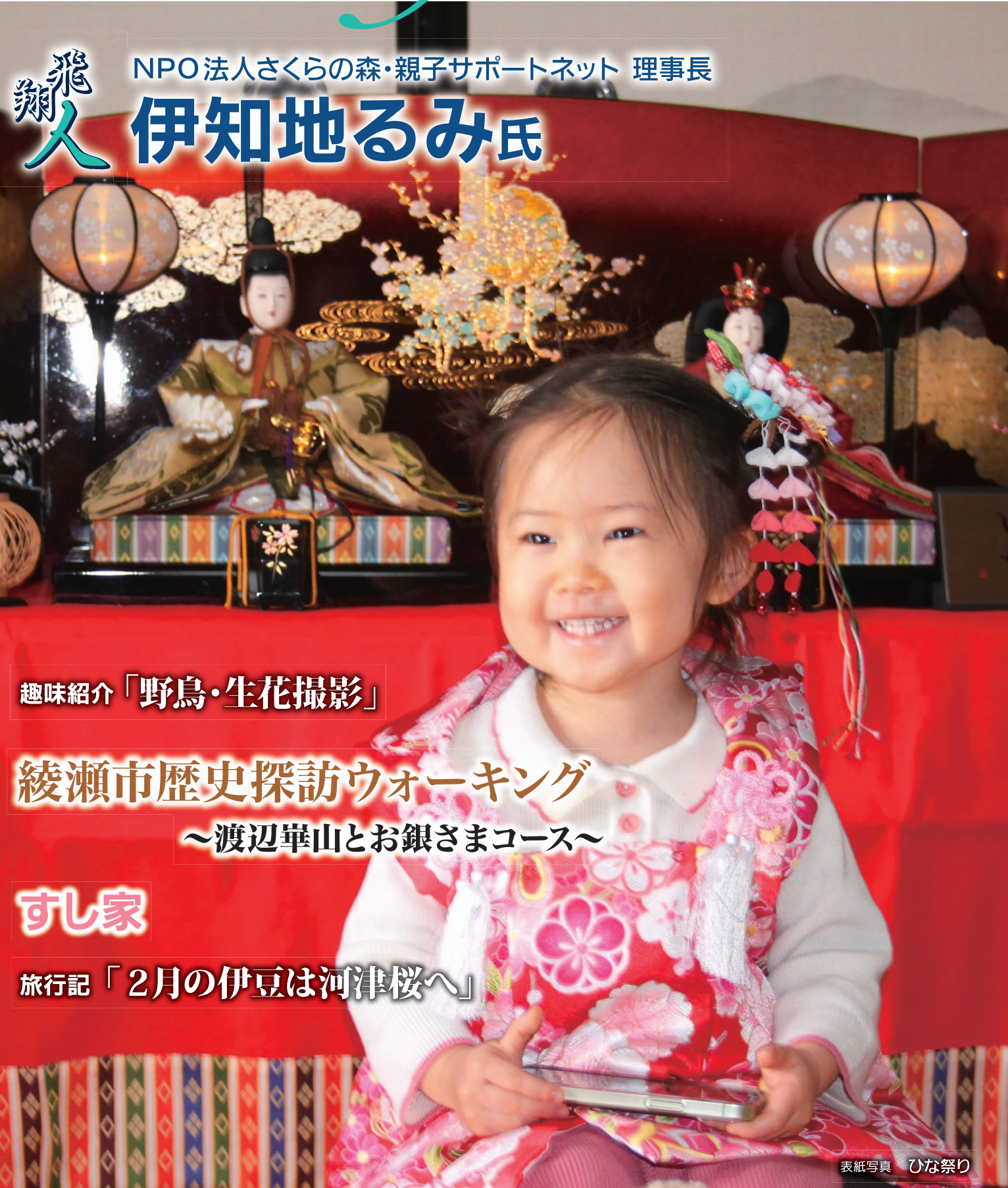
表紙写真 ひな祭り