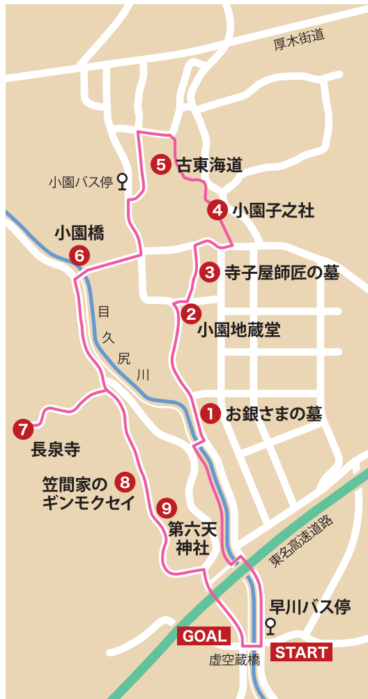
「渡辺華山とお銀さまコース」

お寺から南に300m程歩いた場所に「笠間家のギンモクセイ」という推定樹齢約130年の銀木犀が生えています。こちらの木は綾瀬市指定文化財の他、「かながわの名木100選」にも選定されています。9月下旬から10月上旬には甘い香りの花が咲くそうなので開花時期にも是非訪れてみてください。銀木犀からすぐ南側に最後の散策スポットとなる「第六天神社」があります。早川カミの鎮守で、面足尊・憎根尊の夫婦神が祀られています。境内には立派な桜が生えています。そこから南に500m程歩いて早川バス停に戻るまでが「渡辺華山とお銀さまコース」です。総距離約3・5キロ、程よい起伏もあり丁度良い運動になりました。こちらのコースを紹介している「あやせウォークガイド」は綾瀬市役所生涯学習課窓口で無償配布されています。